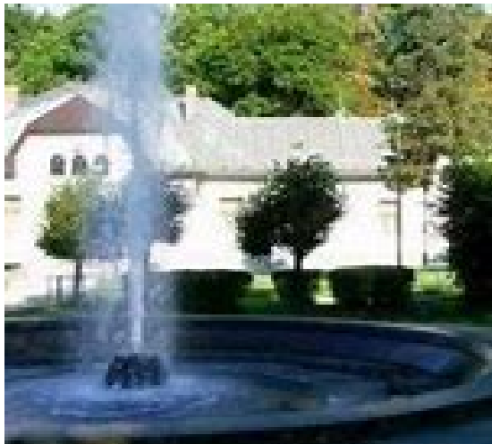
Gejzír v Herľanoch